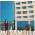
16기 유한솔 (한문교육 13) 삼성전자 해외영업마케팅

군 전역 직후 들어온 인액터스에서, 프로젝트를 통해 생각을 효과적으로 실행하는 방법을 배웠고, 무심코 지나칠 수 있는 주변과 더불어 살아가는 따뜻함을 느낄 수 있었습니다. 자신의 강점과 약점을 정확하게 알게 해주고, 그것들을 보완하면서 우리의 많은 부분을 바꾸어 놓는 것이 인액터스의 가장 큰 매력입니다. 대학생활을 의미 있게 보내고자 하시는 분들은 주저 말고 인액터스의 문을 두드려 주세요.