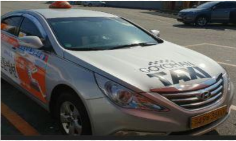
고요한 택시 (동국대학교 인액터스)

프로젝트는 인액터스 활동의 핵심이자, 인액터스를 구성하는 기본적인 단위입니다. 각 프로젝트에서는 지역사회에 특정한 문제에 집중하여, 이를 해결하고 긍정적인 임팩트를 창출할 수 있는 비즈니스 솔루션을 기획합니다. 인액터들은 비즈니스 솔루션을 기획하고 각종 전략을 세워 실행하는 과정에서 다양하고 실전적인 경영 경험을 쌓게 되며, 비즈니스 솔루션의 실행을 통해 지역사회에 긍정적인 임팩트를 창출하며 차세대 비즈니스 리더로 성장하게 됩니다.