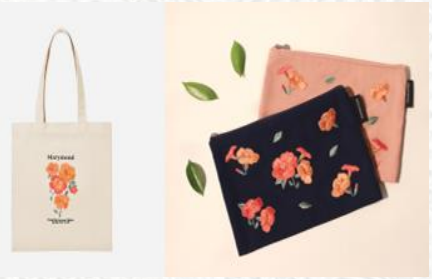
Blooming (고려대학교 인액터스)

‘고요한 택시’ 프로젝트에서는 청각장애인의 경제적 어려움을 해결하기 위해 청각장애인 택시기가 손님들과 소통할 수 있는 어플리케이션을 개발하였고, 이들이 보다 쉽게 택시 면허를 취득하고 취업할 수 있도록 다양한 기관과 파트너십을 체결하였습니다.