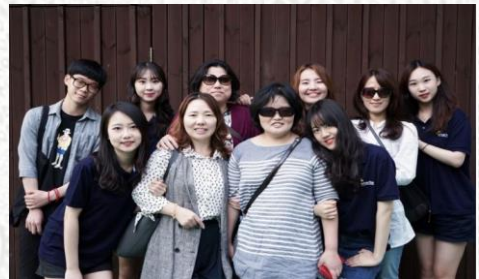
봄그늘 (서울대학교 인액터스)

‘결’ 프로젝트는 청각장애인의 자아실현과 경제적 자립을 목표로 하는 프로젝트입니다. 청각장애인 목수와 함께 ‘메인오브제’라는 브랜드를 런칭하였고, 제품 개발, 브랜딩, 마케팅, B2B, 제조/유통 등 다양한 분야에서 각종 경영 전략을 세워 브랜드를 실제로 운영하였습니다.