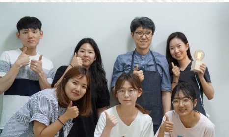
결 (성균관대학교 인액터스)

‘Blooming’ 프로젝트는 현재 유명 소품 브랜드인 ‘마리몬드’의 전신이었습니다. 위안부 문제 해결을 촉구하기 위해 위안부 할머니들의 압화 미술 작품을 활용한 제품을 판매하며 마리몬드 브랜드로 점차 성장하게 되었습니다. 현재 마리몬드는 연 매출 100억 원 규모의 사회적 기업으로 성장하였습니다.